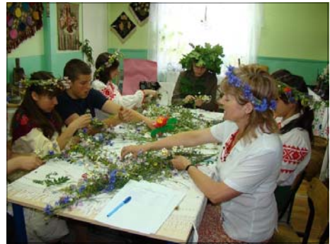
Obrzęd związany z Nocą Kupaly - warsztaty w Zespole Szkół w Czyżach

W letnie miesiące ludności wiejskiej z każdym dniem przybywało pracy i nowych obowiązków - zbliżał się bowiem