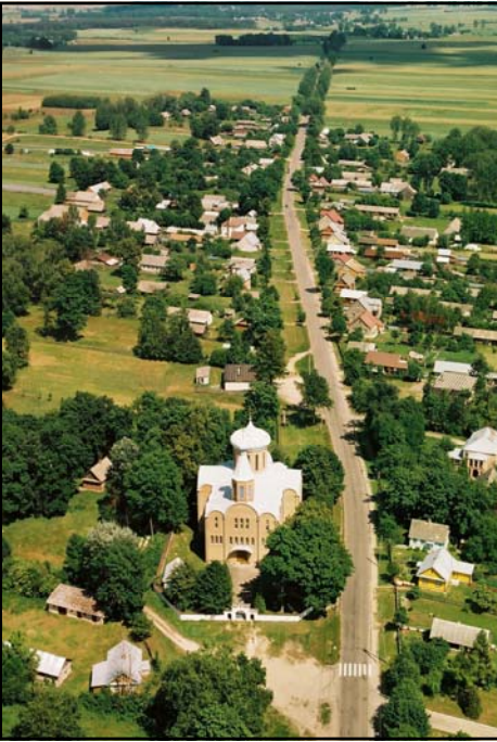
Klejniki - widok z lotu ptaka

spełniali niegdyś szczególną rolę. Była to kategoria ludności służebnej – strzelcy zobowiązani byli do chodzenia na łowy i na wyprawy wojenne, zaś o-socznicy do strzeżenia puszczy królewskich i do udziału w łowach. Zachowany został dawny zabytkowy układ urbanistyczny (ulicówka) oraz drewniane domy z pocz. XX w.