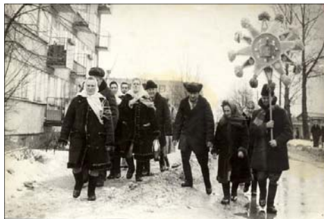
Zespół kołędniczy z Czyż na Wojewódzkich Spotkaniach Kołędniczych w Mońkach

Warto wspomnieć, że kiedyś podczas spożywania postnych potraw kobiety wyciągały spod obrusa siano. Jakiej długości były źdźbła, taki miał być len tego lata. Gospodarz pod koniec wieczery brał łyżkę kuti i podrzucał do sufitu. Następnie liczył - ile ziaren przyklepiło się do sufitu, tyle miało być w da-