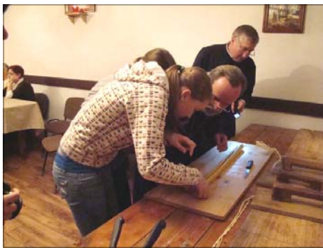
Obrzęd „Świeczka” w Cerkwi p.w. Zaśnięcia NMP w Czyżach ( 2008 r. )

Termin folklor wprowadzony został przez W. J. Thomsona w 1846 roku. Muzykę ludową określa się przede wszystkim jako zbiorową twórczość chłopską: melodie, piosenki i tańce związane z obrzędami i pracą. Muzyka ludowa powstawała od najdawniejszych czasów, gdy nie znano jeszcze zapisu nutowego ani muzycznych terminów. Jest pierwowzorem wszelkiej twórczości muzycznej. W różnych miejscach i regionach kształtowała się odmiennie, zależnie od tego kim byli ludzie zamieszkujący dany region, co ich zaj-