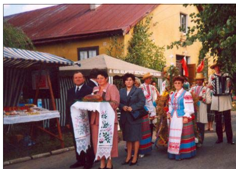
Korowód dożynkowy, Czyże 2004 r.

Na zakończenie kobiety splatały wianek, który nakładały na głowę dziewczyny ( mołoducha ), najlepiej pracującej podczas żniw. Oczywiście także i tej części żniwnego obrzędu towarzyszyły pieśni. Wracając z pola gdy żenicy zbliżali się do domostwa gospodarza śpiewano: „ Zastilajte, pane, stoły i krysla, nese winoczok panienka hreczna ”. Na czele tego pochodu szła