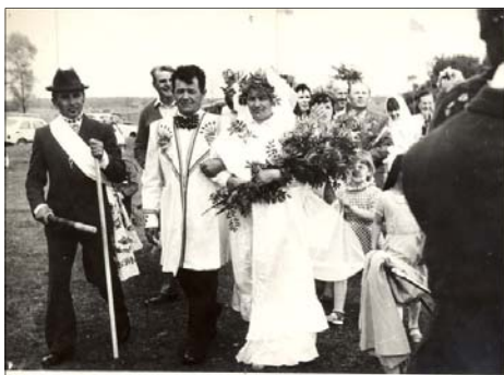
Korowód weselny - zespół obrzędowy z Czyż ( lata 80-te XX w. )

Taniec jest elementem kultury ludowej, tak jak gwara, strój i obrzędy. Towarzyszył mieszkańcom wsi od najdawniejszych czasów, ulegając niezliczonym przeobrażeniom