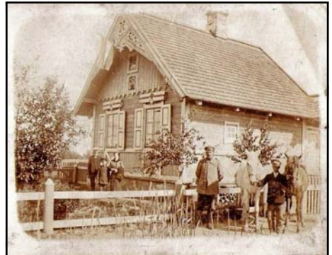
Zabytkowa chata „dróżniczówka” w Zbuczu- zdjęcie z przełomu XIX/XX wieku

- kaplica prawosławna p.w. Św. Aleksego z 1909 r.