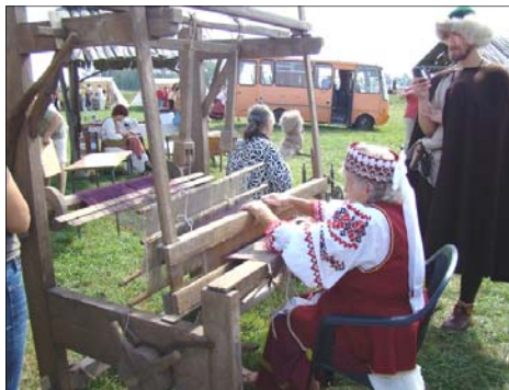
Prezentacja warsztatu tkackiego - Festyn Archeologiczny' Zbucz 2008

Spowodowało to pełniejszy rozwój kulturalny społeczności wiejskiej, także w dziedzinie sztuki. Przeżywała ona rozkwit w XIX wieku kiedy kraj znajdował się pod zaborami. Powstawała na zamówienie i dla potrzeb środowiska wiejskiego, dość zamkniętego, uboższego i mniej wykształconego od innych, izolowanego od głównego nurtu kultury. Również w życiu społeczności regionu Puszczy Białowieskiej pełniła funkcje kultowe (malarstwo religijne), obrzędowe (kostiumy przebierańców, pisanki) oraz prestiżowe (zdobienie przedmiotów użytkowych, urządzenie wnętrz mieszkalnych, stroje). Przedmioty sztuki ludowej wykonywali najczęściej sami mieszkańcy wsi. Architekturę tworzyli wyspecjalizowani cieśle i budowniczowie wiejscy lub małomiasteczkowi.