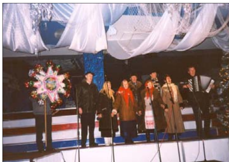
Zespół kolędniczy „Czyżowanie” z Czyż

czynają się tak zwane bohatorye wieczory , które trwały do Nowego Roku. Był to czas wspólnego śpiewania kolęd i gościń, a wieczorami nie można było pracować. Po Bożym Narodzeniu przychodził Nowy Rok, który w miejscowej tradycji zwano również Hohotucha lub Bohaty