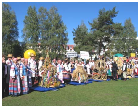
Zespół „Czyżowianie” i „Zbuczanki” na dożynkach wojewódzkich Hajnówka’ 2008 roku

Folklor to ludowa twórczość artystyczna obejmująca: legendy, baśnie, podania, ballady, zagadki, bajki, przysłowia, muzykę (piosenki, tańce), sztukę, zdobnictwo. Różni się