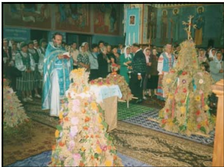
Uroczysta liturgia dożynkowa i wyświęcenie wierców w cerkwi p.w. Zaśnięcia NMP w Czyżach - 2006 r.