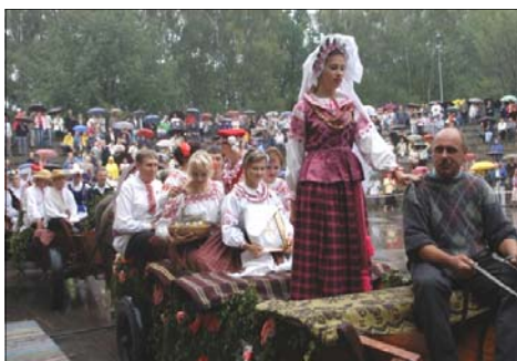
Wyjazd do ślubu - rekonstrukcja obrzędu

Termin folklor wprowadzony został przez W. J. Thomsona w 1846 roku. Muzykę ludową określa się przede wszystkim jako zbiorową twórczość chłopską: melodie, piosenki i tańce związane z obrzędami i pracą. Muzyka ludowa powstawała od najdawniejszych czasów, gdy nie znano jeszcze zapisu nutowego ani muzycznych terminów. Jest pierwowzorem wszelkiej twórczości muzycznej. W różnych miejscach i regionach kształtowała się odmiennie, zależnie od tego kim byli ludzie zamieszkujący dany region, co ich zaj-