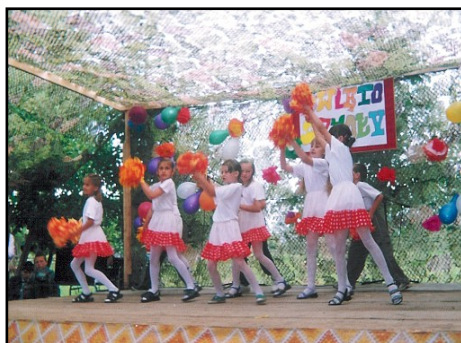
Zespół Taneczny „Iskierki” na Świącie Szkoły w Czyżach - 2002 r.

wzięciem otwartym na różnorodne propozycje organizacyjne i może dlatego właśnie tak długo przetrwały, gościły i nadal goszczą na terenie gminy Czyże. Okazało się raz jeszcze, że jedynie uszanowanie własnych tradycji i wartości ludowej kultury – może prowadzić do podtrzymania wiary środowisk lokalnych we własne siły i własną godność. Podejmując się organizacji "Jesiennych Spotkań z Folklorem" organizatorzy mieli cichą nadzieję, że dołożą małą cegiełkę w tym całym mechanizmie działań popularyzujących i pielęgnujących kulturę ludową naszego regionu. Warto również wspomnieć, że impreza ta znalazła się w "Kalendarzu Imprez Artystycznych Województwa Podlaskiego", a więc już chociażby przez ten fakt, zdobyła określoną rangę.