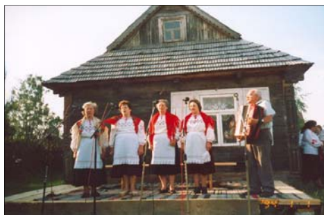
Przeгляд „wesnianok” Zespół Obrzędowy z Kuraszewa Studziwody 2005

Repertuar wesnianok był bardzo rozbudowany. Były również i te przeznaczo-