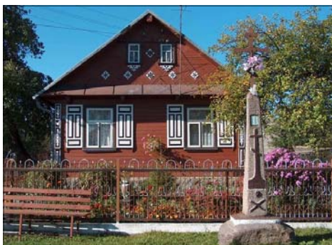
Zabytkowy dom w Czyżach, zdobywca II nagrody w „Konkursie na najlepiej zachowany zabytek budownictwa drewnianego w woj. Podlaskim w 2008 r.

Ta sytuacja stała się pretekstem dla Gminnego Ośrodka Kultury w Czyżach oraz władz samorządowych gminy do podejmowania działań służących ochronie dorobku kulturowego pokoleń, spuścizny naszych przodków i lokalnych tradycji. Szybko okazało się, że tego typu myślenie - to potrzeba chwili dla zachowania własnej tożsamości i świadomości własnej odrębności. Znaczącą rolę w tego typu działaniach na