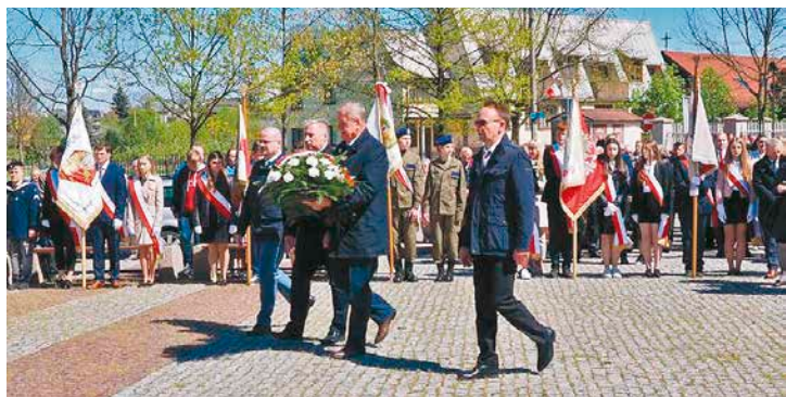
Przedstawiciele władz powiatu bielskiego składają wiązanek pod pomnikiem św. Jana Pawła II