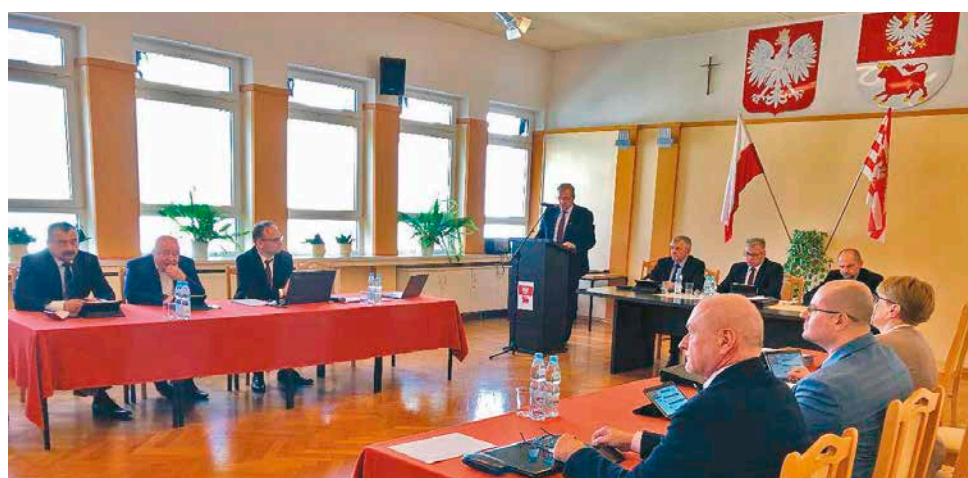
Zarząd powiatu bielskiego podczas obrad 39. sesji rady powiatu otrzymał wotum zaufania i absolutorium z tytułu wykonania budżetu powiatu za 2022 rok

Ponadto rada zapoznała się z informacją o stanie bezpieczeństwa sanitarnego powiatu bielskiego za rok 2022, którą przedstawiła