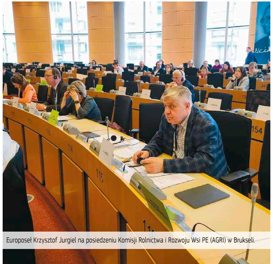
Europoseł Krzysztof Jurgiel na posiedzeniu Komisji Rolnictwa i Rozwoju Wsi PE (AGRI) w Brukseli.

Przypominam sobie, że wówczas – mając na uwadze interes konsumentów europejskich i dobrostanu zwierząt – zwracałem uwagę Komisji Europejskiej, że w Ukrainie nie ma obowiązku stosowania praktyk integrowanej ochrony roślin. W związku z tym podejrzewałem o stosowanie pestycydów, które w Unii Europejskiej są zakazane. Natomiast niekontrolowane warunki przechowywania i transportu mogą się przyczynić do namnożenia patogenów, rozwoju chorób grzybowych,