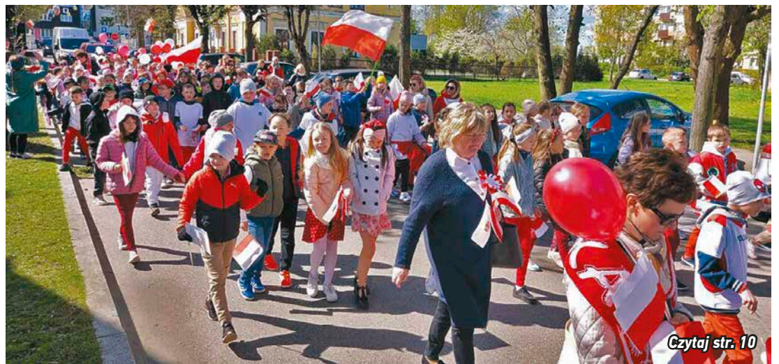
Czytaj str. 10