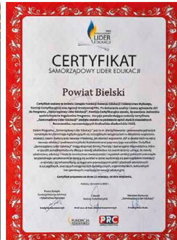
Certyfikaty „Mecenas Wiedzy” oraz „Samorządowy Lider Edukacji”

znawanego na okres roku certyfikatu uzyskują samorządy wdrażające