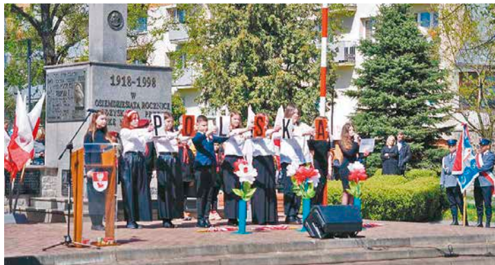
Program patriotyczno-artystyczny zaprezentowała młodzież Szkoły Podstawowej nr 5 im. Szarych Szeregów w Bielsku Podlaskim

Po zakończeniu mszy św. w bazylice uczestnicy uroczystości zgromadzili się przy pomniku św. Jana Pawła II. Składając wieńce i wiązanek kwiatów oddali hołd wielkiemu Polakowi, który z wielką